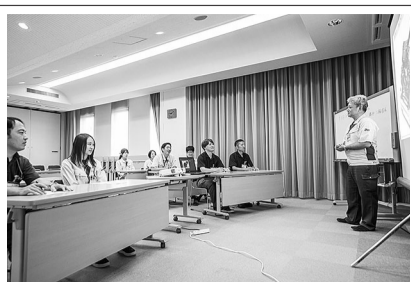
光精工の研修風景

ある。全従業員を対象の任意参加だ。 講師役の従業員はテキストなどの資料を用意し、説明内容も自ら考える。語学講座の講師は入社3年目の女性従業員が担当しており、若手も率先して指南役を引き受けている。 社内研修は受講する従業員の知識・技術力のアップに加え、従業員講師自身のコーチ